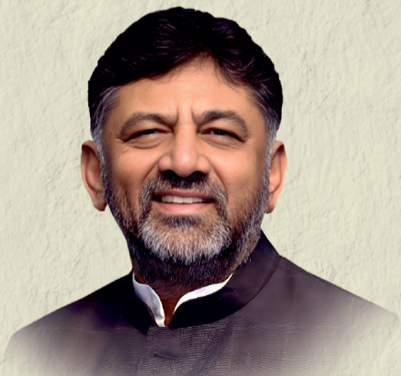
ಶ್ರೀ ಡಿ.ಕೆ. ಶಿವಕುಮಾರ್ ಮಾನ್ಯ ಉಪ ಮುಖ್ಯಮಂತ್ರಿಗಳು

ಶ್ರೀ ಸಿದ್ದರಾಮಯ್ಯ ಸನ್ಮಾನ್ಯ ಮುಖ್ಯಮಂತ್ರಿಗಳು