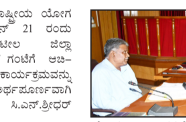
ಯೋಗ ದಿನಾಚರಣೆಯ ಕುರಿತು ಪೂರ್ವ ಸಿದ್ಧತಾ ಸಭೆ